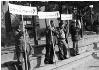
大国公園での案内スタッフ紹介