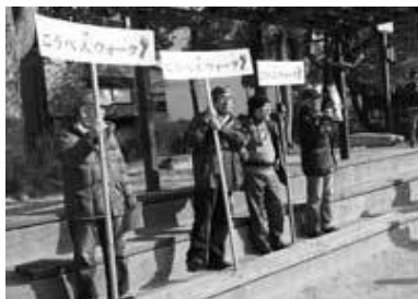
大国公園での案内スタッフ紹介