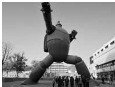
鉄人28号の前で解説