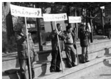
大国公園での案内スタッフ紹介