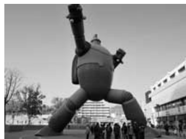
鉄人28号の前で解説